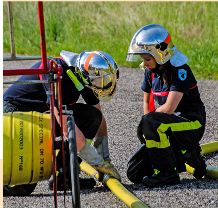
▲ Épreuves du brevet