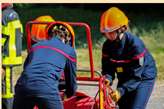
▼ La formation complémentaire