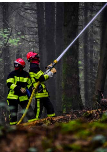
▲ Ce binôme de sapeurs-pompiers est en première ligne pour lutter contre l'incendie