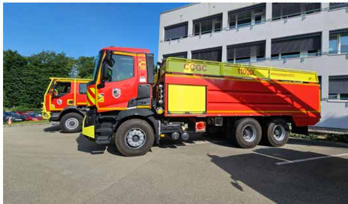
▲ Le CCGC est attribué à la caserne de l'Isle-sur-le-Doubs