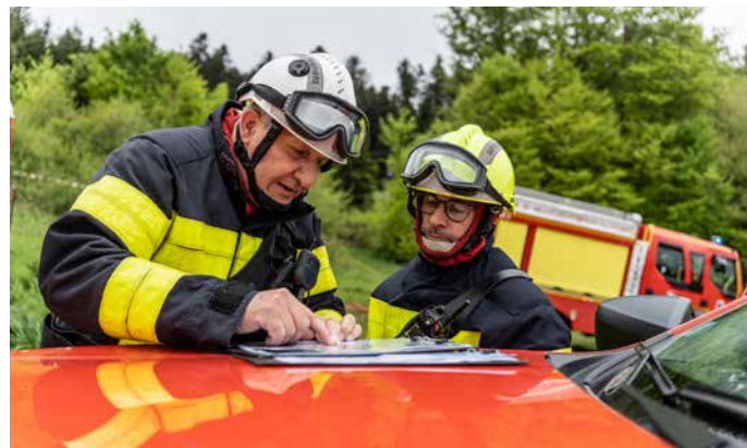
Les sapeurs-pompiers planifient et coordonnent leurs actions pour lutter contre le feu de forêt

La forêt couvre 43 % du territoire départemental