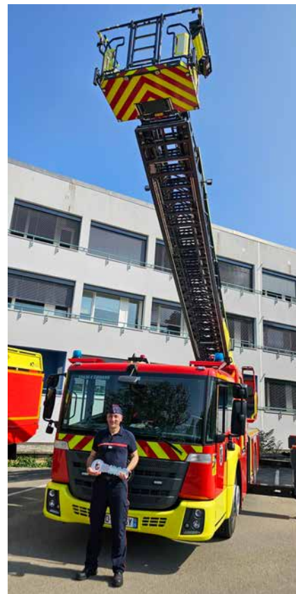
▲ L'EPC32 rejoint la caserne d'Ornans

Pour rappel, le Pacte Capacitaire est une aide consentie par l'État permettant aux SDIS de bénéficier d'un cofinancement de l'État et des collectivités territoriales pour acquérir des capacités opérationnelles supplémentaires afin de lutter contre les feux de forêts.