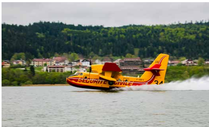
◀ Un Canadair de la Sécurité Civile écope dans le lac de Saint-Point, à Malbuisson