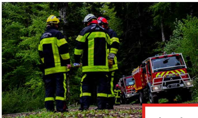
▲ Les équipes sapeurs-pompiers de chaque engin débriefent leurs actions après l'entraînement