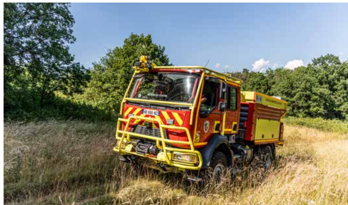
▲ Le CCF fait partie de la caserne de Besançon Centre

Le 13 juin dernier, avant son Conseil d'Administration, le Service départemental d'incendie et de secours du Doubs a reçu trois nouveaux engins qui sont venus renforcer les moyens opérationnels déjà déployés à travers le département.