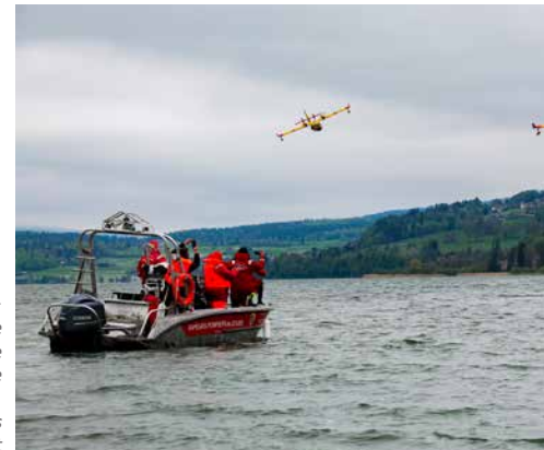
Vue exceptionnelle au Lac de Saint-Point, deux canadairs écopent

La mise en place d'un poste de commandement opérationnel permet d'améliorer la coopération interservices et la gestion de crise